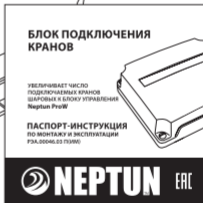
Паспорт. Инструкция по монтажу и эксплуатации