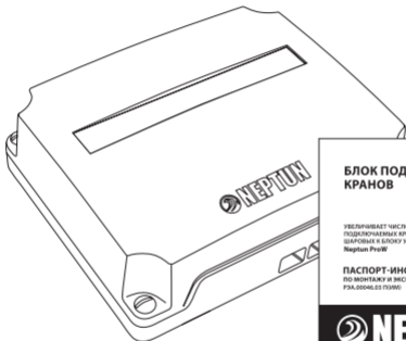
Блок подключения кранов ProW