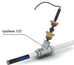
Рис. 4 - Схема ввода нагревательной секции внутрь трубопровода под углом 120°