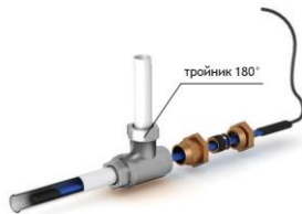
Рис. 2 - Схема прямого ввода нагревательной секции внутрь трубопровода